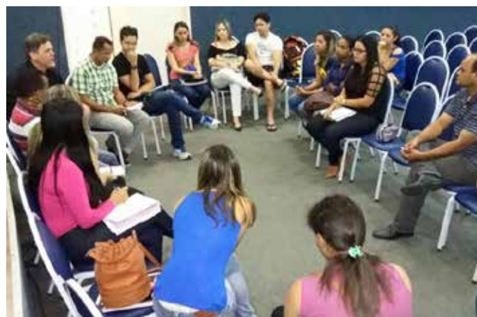
Grupos discutem um dos eixos durante Evento Preparatório em CG Auditorio Maria Marques, sede do CRP-13.

Este ano, os eventos preparatórios organizados pelo CRP-13 trouxeram a conferência “Contribuições Éticas, Políticas e Técnicas ao Processo Democrático e de Garantias de Direitos”.