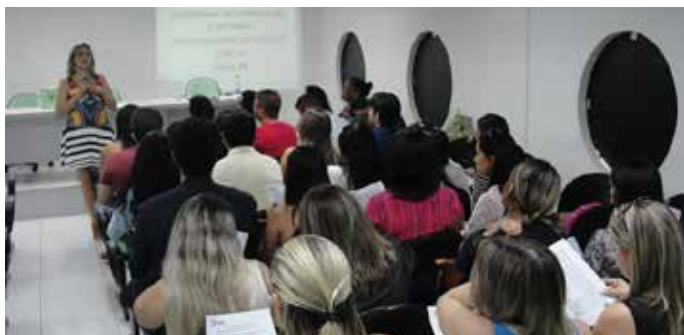
Pré-Congresso em Patos

A partir da temática, estudantes e profissionais da Psicologia elaboraram as primeiras propostas regionais e nacionais que vieram a ser apreciadas e votadas durante os Pré-Congressos.