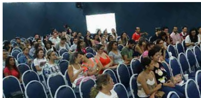
Pré-Congresso em Campina Grande