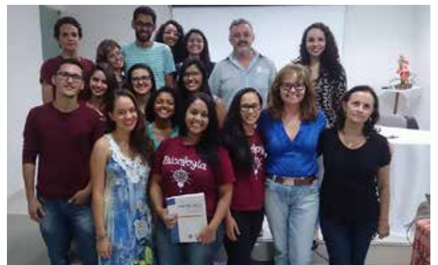
Vindos de Campina Grande, alunos da UEPB visitam as instalações da sede do CRP-13 em João Pessoa