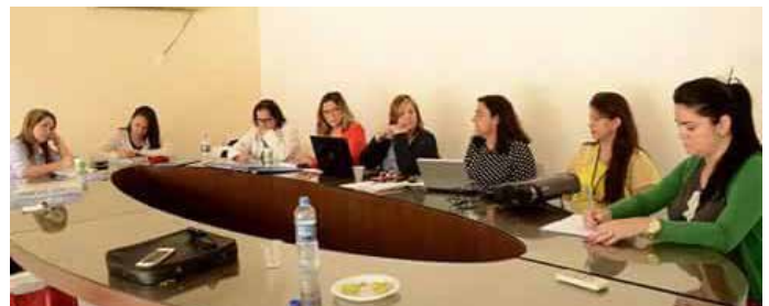
Em parceria com a ABEP e representantes dos cursos de Psicologia da Paraíba, GT organizado pelo CRP-13 discute formação em Psicologia no Estado.