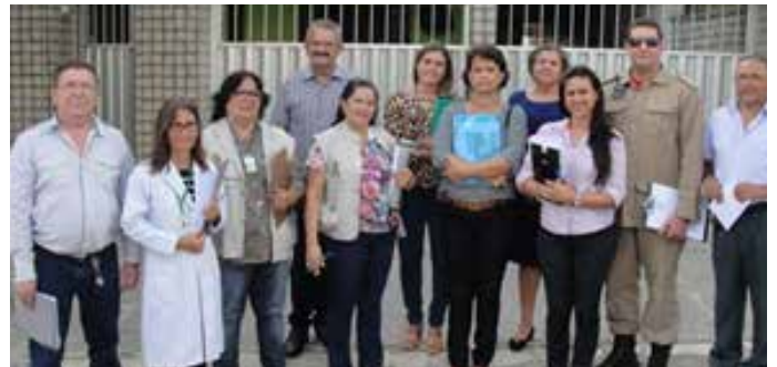
Comitê Permanente de Monitoramento e Fiscalização das ILPIs durante uma de suas visitas