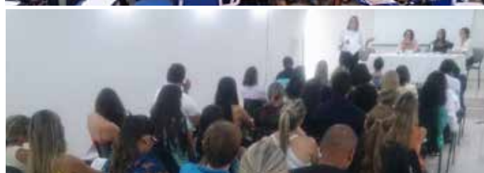
CRP-13 dá as boas-vindas aos nossos Psicólogos paraibanos

A Psicologia é a sua cara. Faça dela sua identidade.