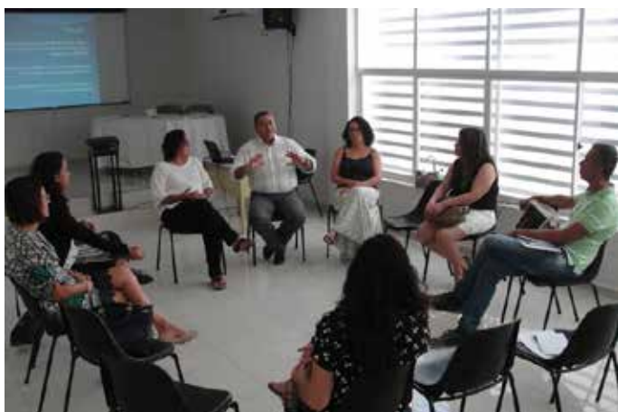
Grupo discute as propostas durante evento preparatório na capital